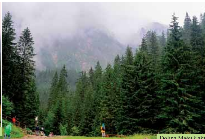
Dolina Małej Łąki