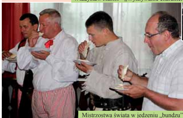
Mistrzostwa świata w jedzeniu „bundzu”