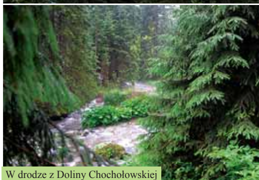
W drodze z Doliny Chochołowskiej