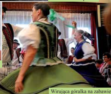
Wirująca góralka na zabawie