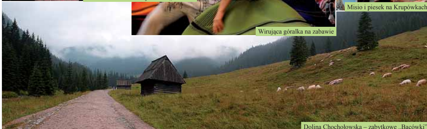
Dolina Chochołowska – zabytkowe „Bacówki”