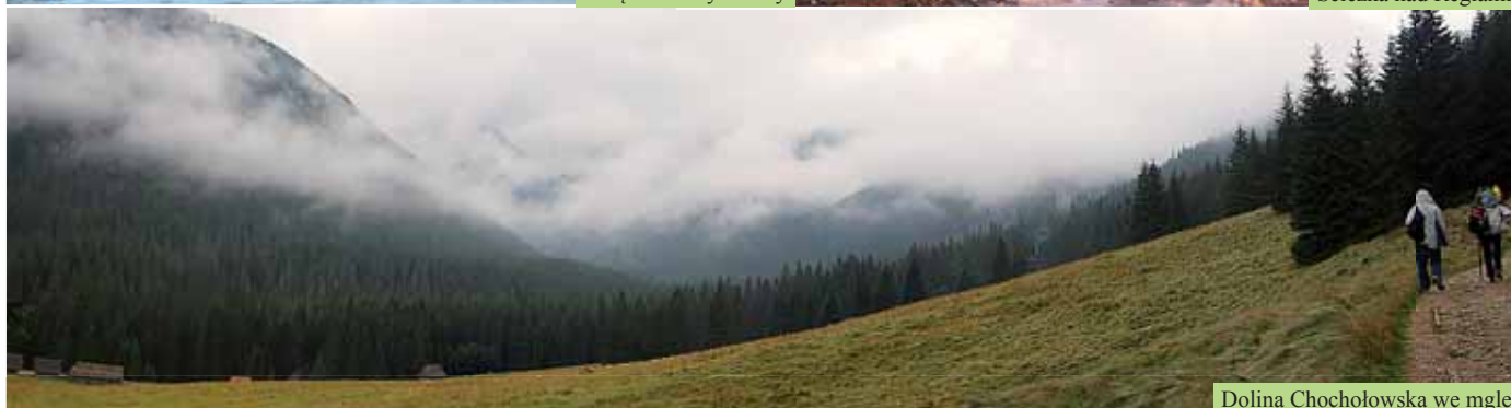
Dolina Chochołowska we mgłę