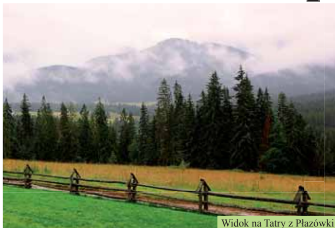
Widok na Tatry z Plazówki