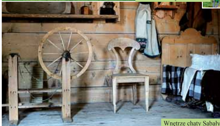
Wnętrze chaty Sabaly