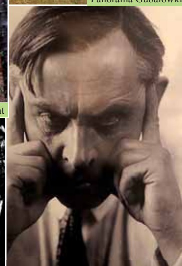
Witkacy i jego „Psychoholizm”