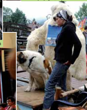
Misio i piesek na Krupówkach