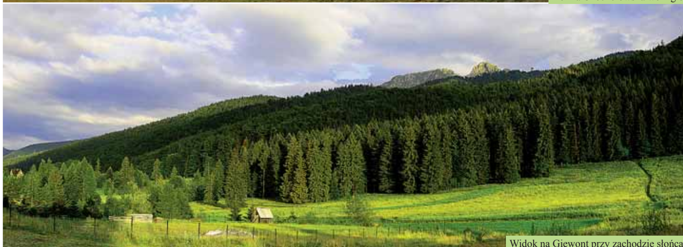
Widok na Giewont przy zachodzie słońca