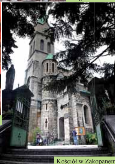
Kościół w Zakopanem