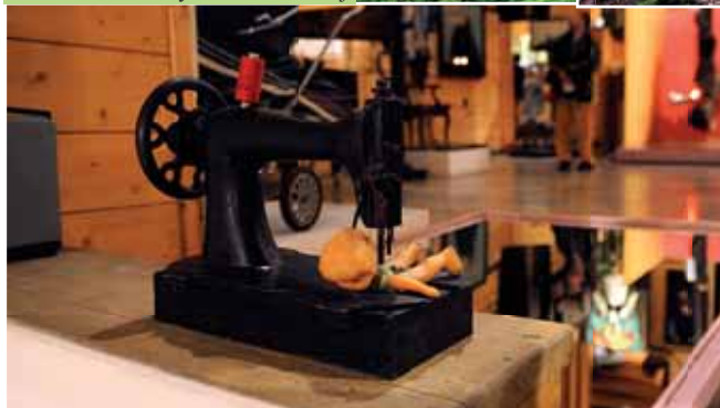
Władysław Hasiór - „Wyszywanie charakteru”