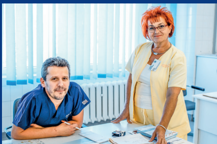
Poradnia Chirurgii Naczyń