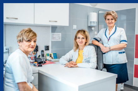
Poradnia Medycyny Pracy