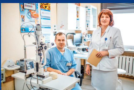
Poradnia Okulistyczna III Retinopatii Cukrzycowej