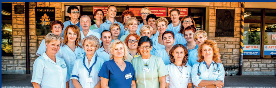
Poradnia Lekarza Rodzinnego – POZ