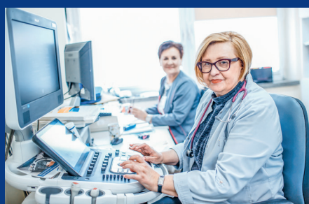
Poradnia Kardiologii Dziecięcej