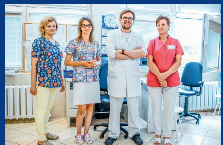
Opieka Nocna i Świąteczna