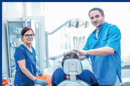
Poradnia Chirurgii Szczękowo-Twarzowej