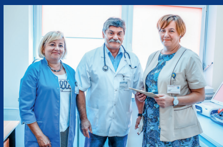
Poradnia Kardiologiczna II Kontroli Stymulatorów