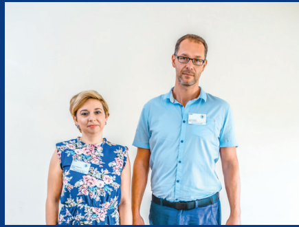
Służba BHP i Ochrony P/POŻ.