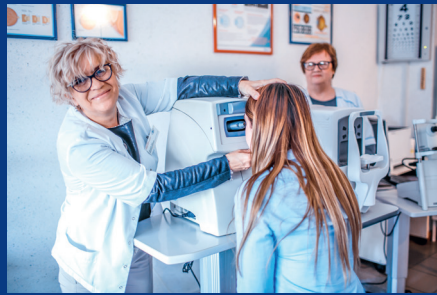
Poradnia Leczenia Jaskry