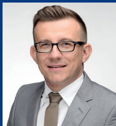
Przewodniczący Rady Społecznej Szpitala Prezydent Miasta Zamość Andrzej Wnuk