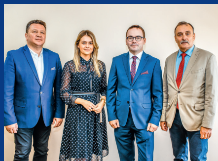
Zespół Radców Prawnych